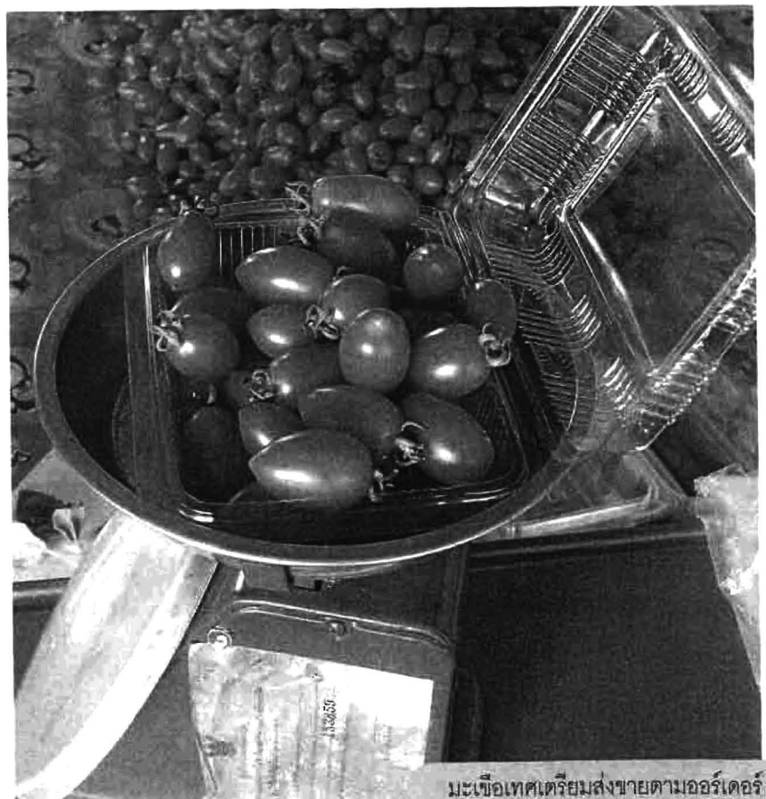
มะเขือเทศเตรียมส่งขายตามออร์เดอร์

"ในจังหวัดสุพรรณบุรีมีคนปลูกมะเขือเทศอยู่หลายราย แต่เขาจะปลูกเป็นพื้นที่เปิดและส่งขายตามตลาดทั่วไป แต่ของเราปลูกแบบเกษตรประณีต ซึ่งเราไม่เน้นการผลิตปริมาณมากๆ แต่เราเน้นที่คุณภาพ และขายตลาดระดับบน ผมตั้งใจที่จะทำให้มะเขือเทศนี้เป็นผลไม้ เพราะมีลักษณะพิเศษเฉพาะ คือ กรอบ เนื้อแน่น ไม่มีเมล็ด ตรงนี้ก็จะเป็นจุดขายของมะเขือเทศของเรา ที่ผมเลือกปลูกมะเขือเทศ GAP เพราะผมจับกระแสผู้บริโภคมองที่ตลาดสุขภาพ เพราะปัจจุบันนี้ผู้บริโภคจะเน้นการรับประทานอาหารที่มีประโยชน์และดีต่อสุขภาพ และถ้าเรา