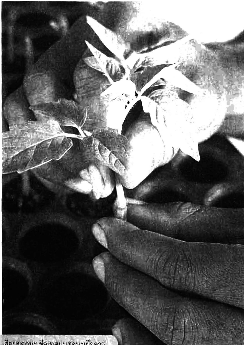
เสียบยอดมะเขือเทศบนตอมะเขือจาว

มะเขือเทศจะแข็งแรงมาก หากเป็นในช่วงฤดูร้อน ที่อากาศร้อนมากๆ มะเขือเทศก็สามารถเจริญเติบโตและให้ผลผลิตปกติ ไม่เป็นโรค แต่หากเป็นต้นมะเขือเทศที่ปลูกตามปกติ จะเกิดปัญหาโรคโคนเน่าและยืนต้นตาย