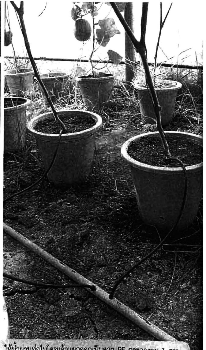
ให้น้ำผ่านท่อไมโครแล้วแยกออกเป็นสาย PE กระถางละ 1 สาย