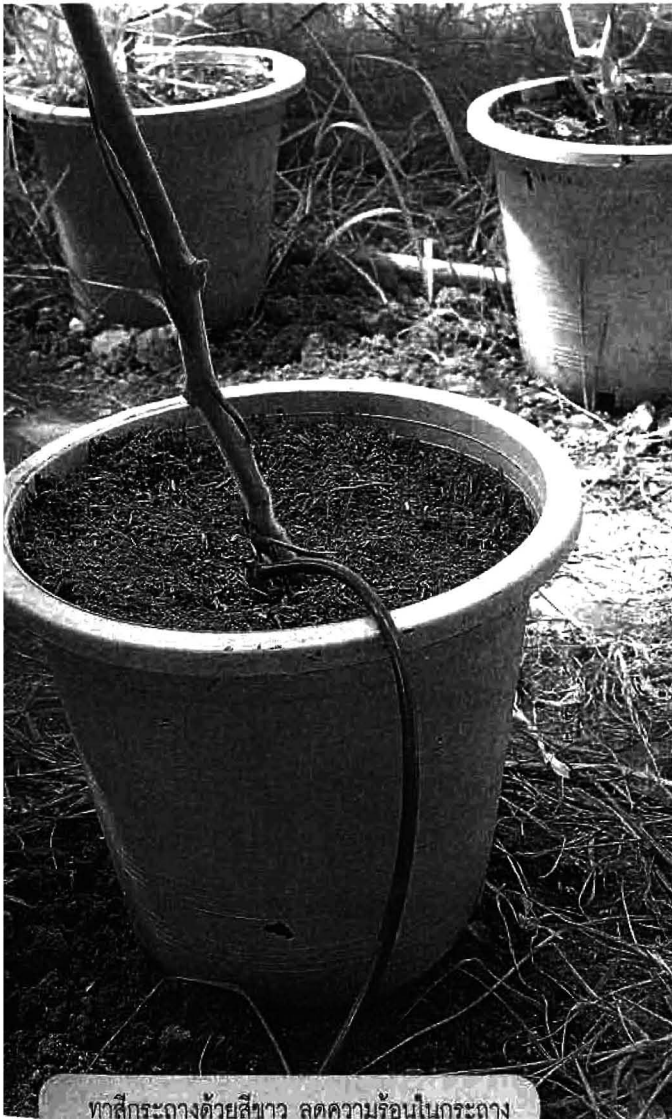
ทาสีกระถางด้วยสีขาว ลดความร้อนในกระถาง

จากนั้นยกระถางไปวางเรียงกันในโรงเรือน ซึ่งวิธีนี้คุณปิยะแนะนำว่าให้เอากะถางไปตั้งในโรงเรือนก่อน แล้ว