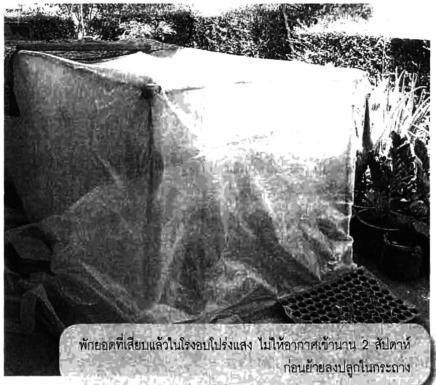
พักยอดที่เสียบแล้วในโรงอบโปร่งแสง ไม่ให้อากาศเข้านาน 2 สัปดาห์ก่อนย้ายลงปลูกในกระถาง

แม้จะทราบดีกว่าการทำเกษตรในสภาวะที่อุณหภูมิอากาศที่เปลี่ยนแปลงอย่างรวดเร็วเป็นเรื่องที่ไม่ง่ายนัก แต่คุณมิยะก็พยายามปลูกมะเขือเทศแบบประณีตด้วยปลูกในโรงเรือนและดูแลด้วยวิถีธรรมชาติ แม้จะมีการใช้ปุ๋ยเคมีบ้าง แต่ก็ใช้ในปริมาณที่น้อยอยู่ในเกณฑ์ที่ปลอดภัย เพื่อให้ได้ผลผลิตมะเขือเทศคุณภาพดี