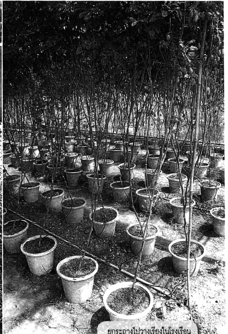
ยกระถางไปวางเรียงในโรงเรือน