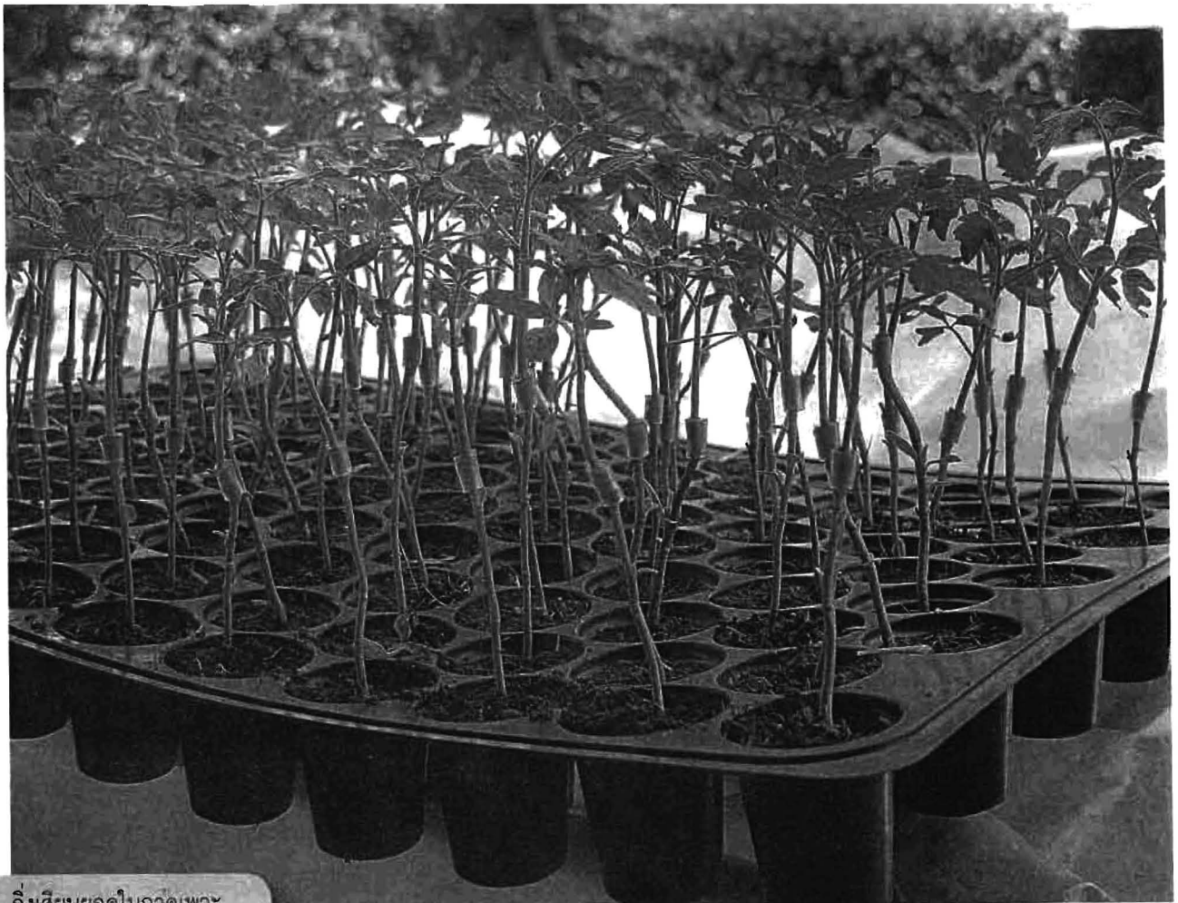
กิ่งเสียบยอดในถาดเพาะ

"ในจังหวัดสุพรรณบุรีมีคนปลูกมะเขือเทศอยู่หลายราย แต่เขาจะปลูกเป็นพื้นที่เปิดและส่งขายตามตลาดทั่วไป แต่ของเราปลูกแบบเกษตรประณีต ซึ่งเราไม่เน้นการผลิตปริมาณมากๆ แต่เราเน้นที่คุณภาพ และขายตลาดระดับบน ผมตั้งใจที่จะทำให้มะเขือเทศนี้เป็นผลไม้ เพราะมีลักษณะพิเศษเฉพาะ คือ กรอบ เนื้อแน่น ไม่มีเมล็ด ตรงนี้ก็จะเป็นจุดขายของมะเขือเทศของเรา ที่ผมเลือกปลูกมะเขือเทศ GAP เพราะผมจับกระแสผู้บริโภคมองที่ตลาดสุขภาพ เพราะปัจจุบันนี้ผู้บริโภคจะเน้นการรับประทานอาหารที่มีประโยชน์และดีต่อสุขภาพ และถ้าเรา